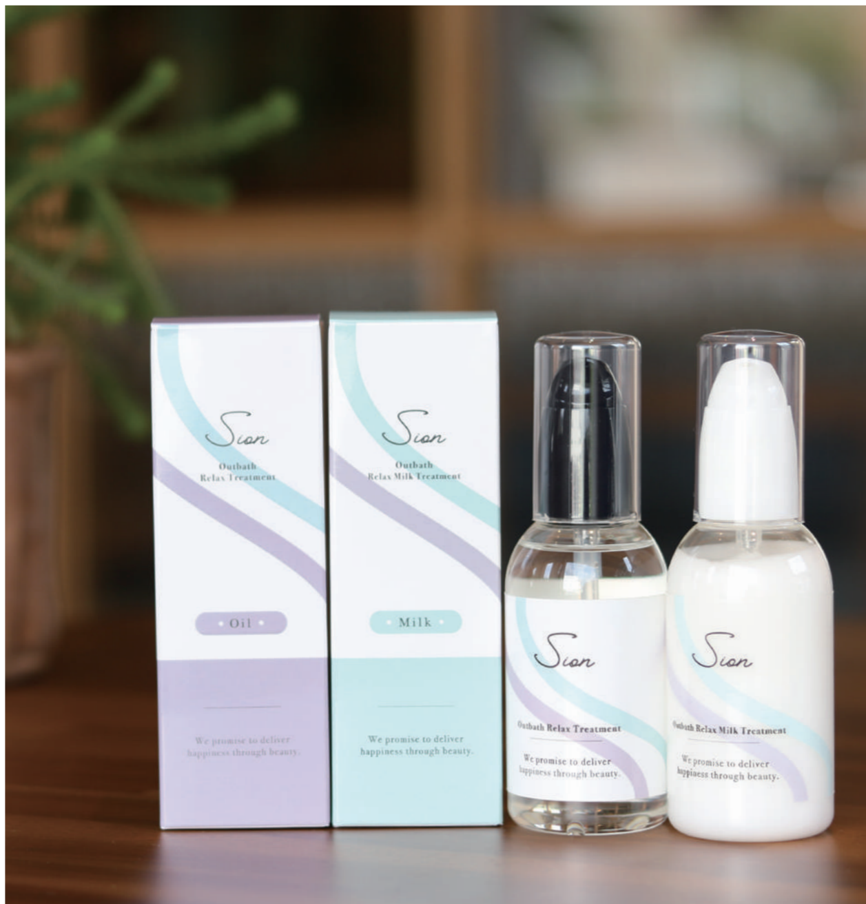
Sion アウトバストリートメント (オイル&ミルク) 80 ml 2,640円(税込)